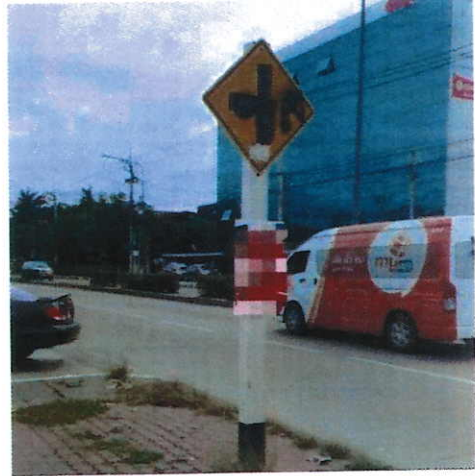
ภาพที่ ๖ บริเวณถนนเลี้ยวเมืองปากเกร็ด จ.นนทบุรี วันที่ ๒๔ สิงหาคม ๒๕๖๐