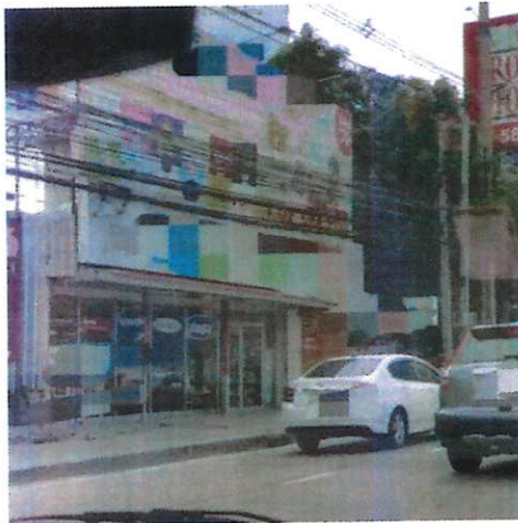
ภาพที่ ๓ บริเวณถนนแจ้งวัฒนะ จ. นนทบุรี วันที่ ๒๔ สิงหาคม ๒๕๖๐