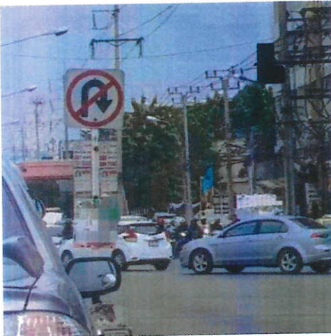
ภาพที่ ๗ บริเวณแยกสนามบินน้ำ จ.นนทบุรี วันที่ ๒๔ สิงหาคม ๒๕๖๐