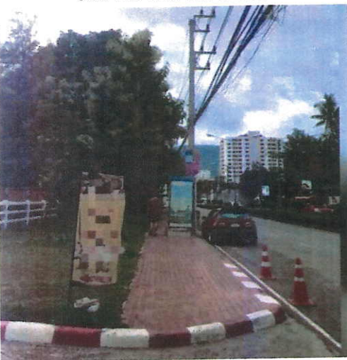
ภาพที่ ๙ บริเวณถนนห้วยแก้ว จ.เชียงใหม่ วันที่ ๒๕ สิงหาคม ๒๕๖๐