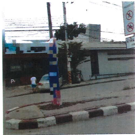
ภาพที่ ๒ บริเวณถนนศรีสมาน จ.นนทบุรี วันที่ ๒๗ สิงหาคม ๒๕๖๐