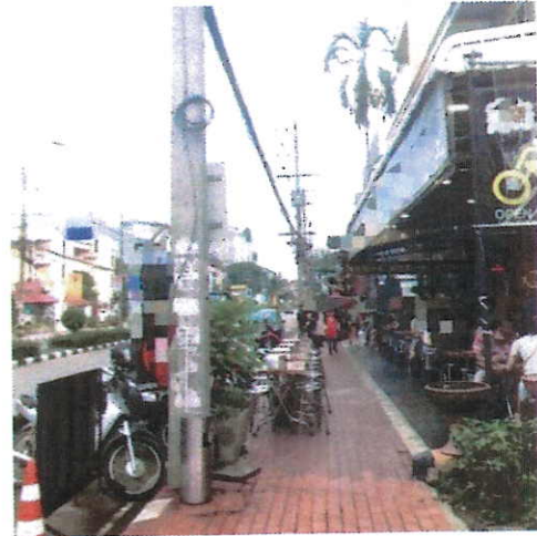
ภาพที่ ๘ บริเวณถนนห้วยแก้ว จ.เชียงใหม่ วันที่ ๒๕ สิงหาคม ๒๕๖๐