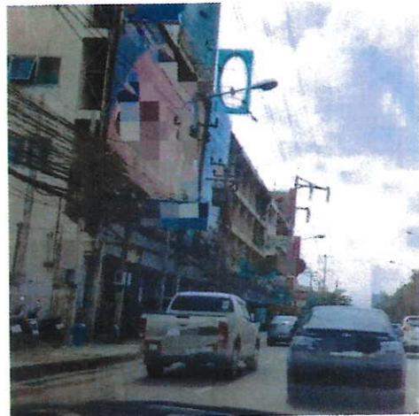
ภาพที่ ๔ บริเวณถนนติวานนท์ จ.นนทบุรี วันที่ ๒๔ สิงหาคม ๒๕๖๐