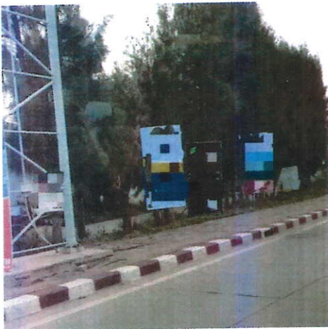
ภาพที่ ๑ บริเวณถนนศรีสมาน จ.นนทบุรี วันที่ ๒๗ สิงหาคม ๒๕๖๐

การวางป้ายโฆษณาหรือสิ่งอื่นใดบนทางสาธารณะเป็นสิ่งที่พบเห็นทั่วประเทศ ซึ่งสร้างความลำบากให้แก่ประชาชนผู้สัญจรไปมาบนทางเท้า รวมถึงทัศนวิสัยในการมองของผู้ใช้ถนน ในความรับรู้ ของประชาชนทั่วไปอาจเห็นว่าสิ่งเหล่านี้เป็นสิ่งทั่วไป ทั้งนี้ มีข้อกำหนดที่กำหนดไว้อย่างชัดเจนถึงหลักเกณฑ์และข้อห้ามเกี่ยวกับเรื่องดังกล่าว ซึ่งส่วนใหญ่ป้ายโฆษณาหรือสิ่งอื่นใดที่พบเห็นทั่วไปนั้น ไม่ได้ถูกต้องตามข้อกำหนดของกฎหมาย ดังภาพที่ได้จากการลงพื้นที่สำรวจ ดังนี้