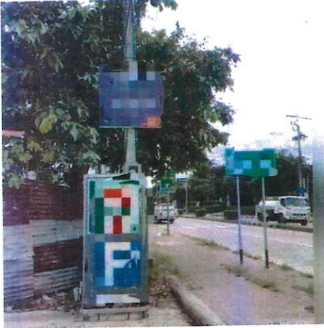
ภาพที่ ๕ บริเวณถนนเลี้ยวเมืองปากเกร็ด จ.นนทบุรี วันที่ ๒๔ สิงหาคม ๒๕๖๐